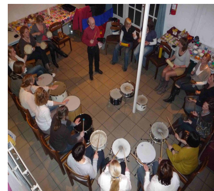
Ritmeworkshop als vrijetijdsbesteding.

Zijn aanbod is heel divers, waaronder ook deze ritmeworkshop voor kleine bedrijven als teambuildingsdag