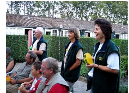
Ritmeworkshop voor IVN Zomerweek.