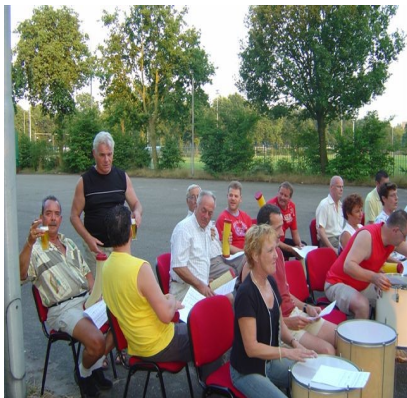
Ritmeworkshop voor Cornu Copiae.

over de workshops kunt U altijd bij hem terecht.