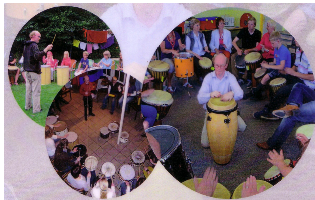
Ook voor familie en kinderfeestjes, een leuk idee!

Esdé Stijn Derwig 013 8795688 ajcderwig@online.nl www.ritmeworkshops.com